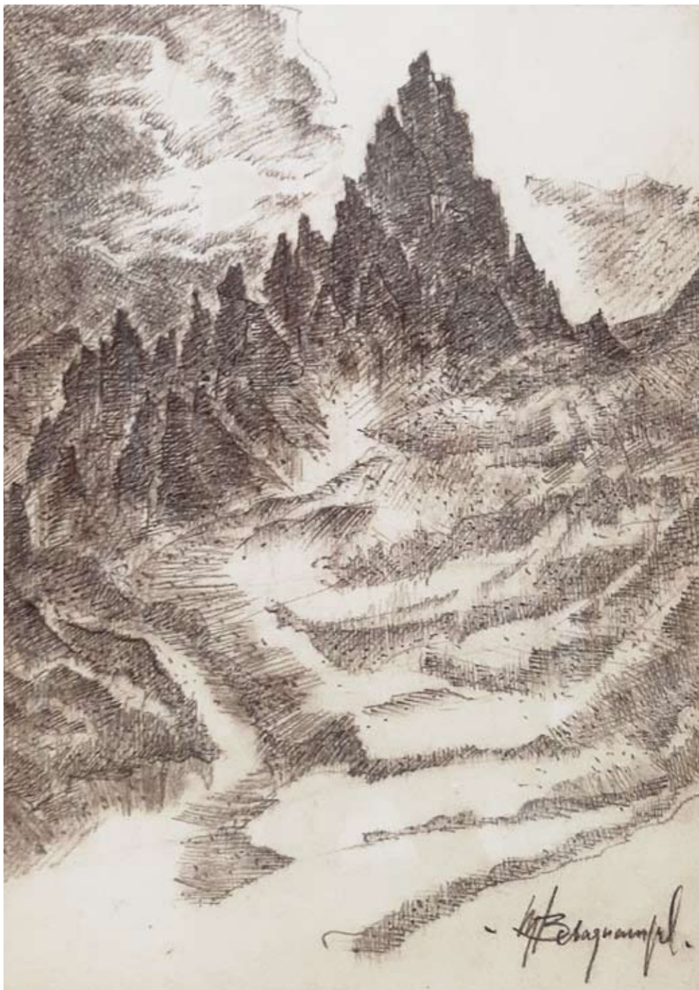
Сююрю-Кая. Вершины. 2006. Бумага, сепия