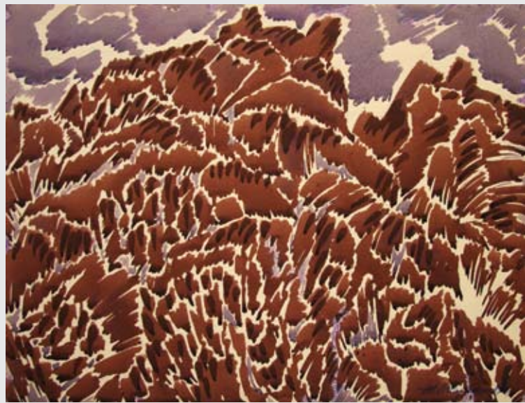
Карадаг. Хребет Кара-Агач. 1989-2020. Бумага, акварель, пастель

сийском музее А. С. Пушкина на набережной Мойки, 12, в 2008 принятую Музеем в дар.