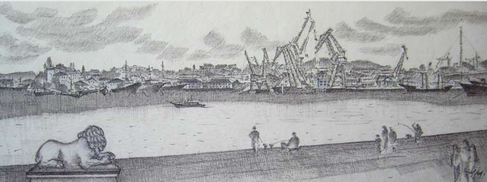
Севастополь. Графская пристань. 1999-2005. Бумага, сепия