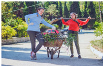
Обрезка кустарников в мемориальном парке