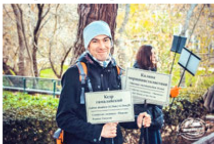
Установка информационных табличек с названием растений

В течение школы волонтерами была проделана большая работа. Реконструировано 2 информационных стенда, покрашено 7 скамеек и установлено 50 информационных табличек с названиями растений в мемориальном парке.