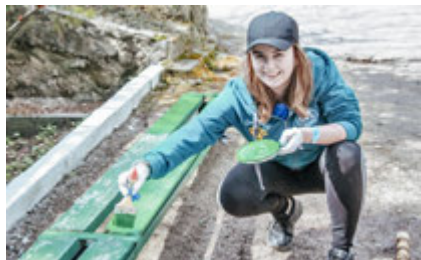
Школа кэмп-лидеров и медиаволонтеров. Апрель 2019 г. Покраска скамеек в мемориальном парке

Волонтеры разделились на несколько групп. Одна группа помогала благоустраивать территорию мемориального парка-усадьбы, были покрашены 7 лавок, побелены бордюры, обрезаны сухие ветки 6 деревьев и 9 кустарников.