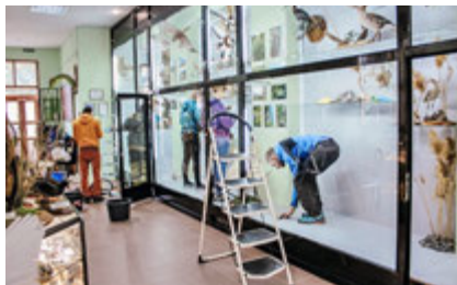
Санитарная уборка витрин в Музее истории и природы

Вторая группа очищала Карадагский ручей от мусора перед началом курортного сезона. В результате в нем было собрано 5 м 3 мусора.