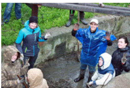
Очистка Карадагского ручья оказалась непростой задачей, но волонтеры с ней успешно справились

Самым сложным оказалось почистить Карадагский ручей от мусора. Было собрано 6 м 3 мусора (бутылки, мусор растительного происхождения).