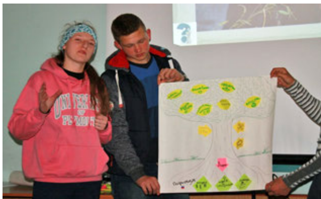
Волонтерская школа «Карадаг-2017». Практикум «Что дает волонтерство участнику и ООПТ».

Такие занятия всегда сближают участников, позволяют генерировать новые творческие идеи, а затем воплощать их в жизнь.