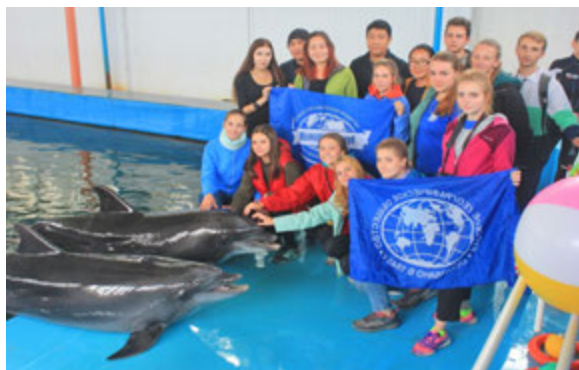
Участники Волонтерской школы «Карадаг – 2018» в Карадагском дельфинарии

В апреле 2019 года Карадагский заповедник стал площадкой для отработки практических навыков кэмп-лидеров и медиаволонтеров. В проекте приняли участие победители конкурсного отбора – 50 юношей и девушек из 26 городов России. Интересен тот факт, что Волонтерская школа РГО, организованная АНО «Гудсерфинг» стала первым пилотным офлайн проектом в России по подготовке кэмп-лидеров и медиаволонтеров.